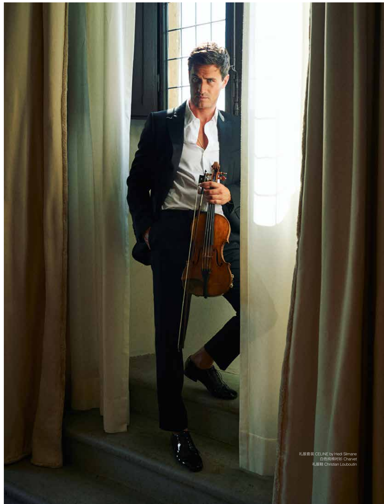
礼服套装 CELINE by Hedi Slimane 白色纯棉衬衫 Charvet 礼服鞋 Christian Louboutin