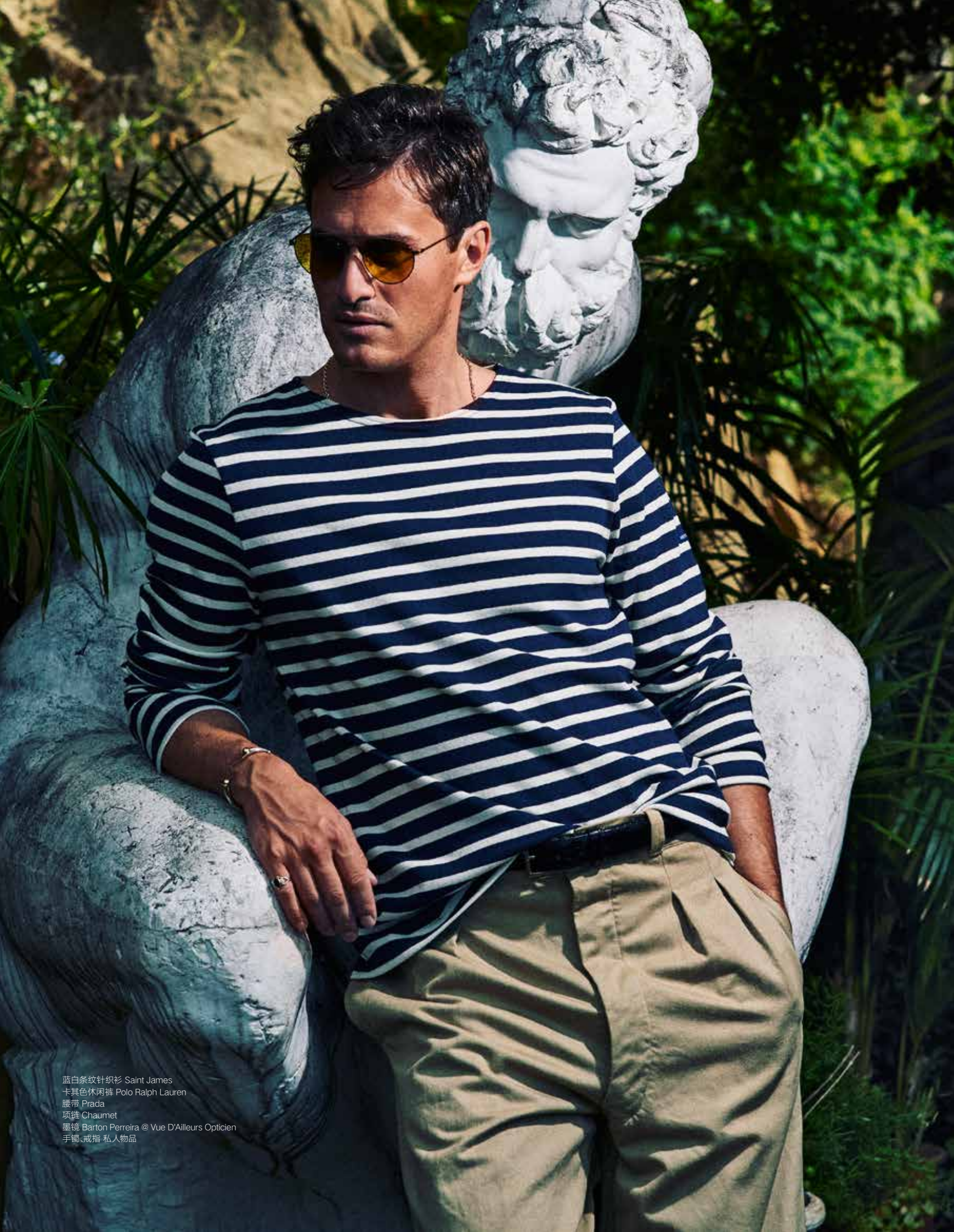
蓝白条纹针织衫 Saint James 卡其色休闲裤 Polo Ralph Lauren 腰带 Prada 项链 Chaumet 墨镜 Barton Perreira @ Vue D'Ailleurs Opticien 手镯、戒指 私人物品