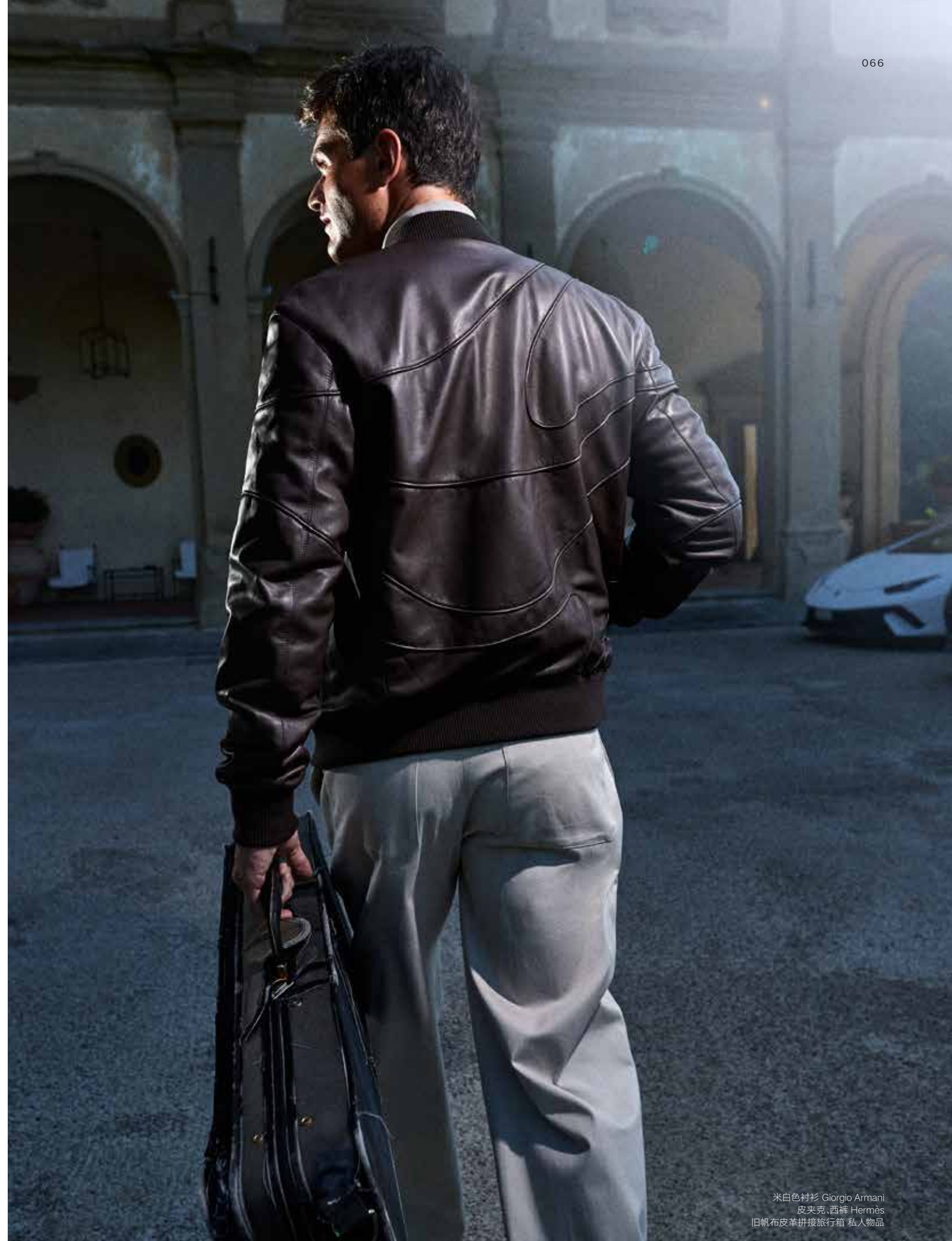
米白色衬衫 Giorgio Armani 皮夹克、西裤 Hermès 旧帆布皮革拼接旅行箱 私人物品